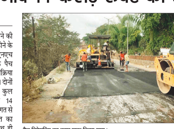
पैच रिपेयरिंग का काम शुरू किया गया।

शहर को जर्जर सड़कों से अब मुक्ति मिलने की उम्मीद जगी है। बारिश का मौसम समाप्त होने के बाद शहर के बीच मौजूद लोनिवि और एनएच की सड़कों के पैच रिपेयरिंग की प्रक्रिया शुरू कर दी गई है। दोनों ही विभागों द्वारा कुल मिलकर लगभग 14 करोड़ रुपए की लागत से सड़कों के मरम्मत का कार्य कराया जाएगा। इसमें जिले के साथ ही संभागरभर में आने वाले वाली एनएच की प्रमुख सड़कें भी शामिल हैं। इस बीच लोनिवि ने सड़कों के मरम्मत का कार्य शुरू कर दिया है। सरगुजा में इस बार मानसून में जमकर बारिश हुई। समय से पहले पहुंचे मानसून के कारण